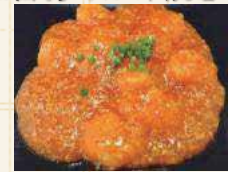
海老のチリソース煮