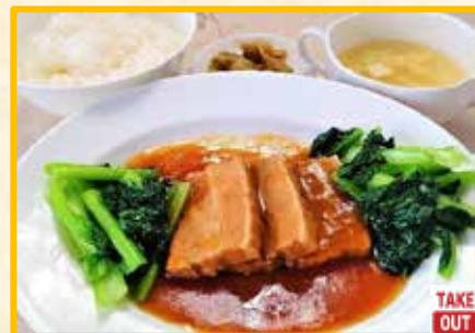
豚肉の柔らかか煮