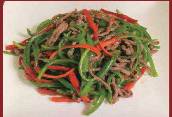
◎牛肉とピーマンの細切り炒め