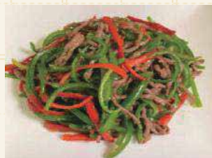
牛肉とピーマンの細切り炒め