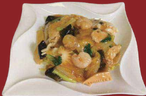
◎五目あんかけ焼きそば