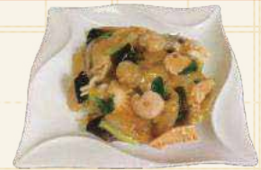
五目あんかけ焼きそば