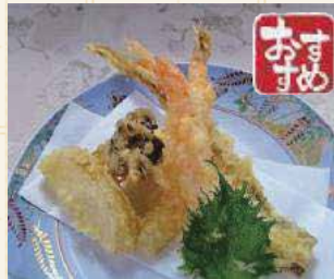
天ぷら盛り合わせ