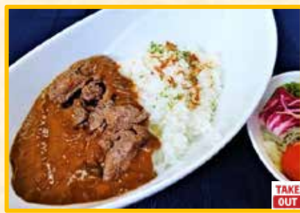
カットビーフのせカレー