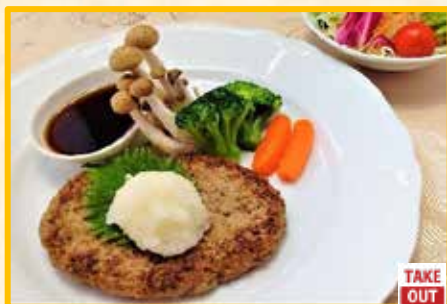
和風おろしハンバーグ