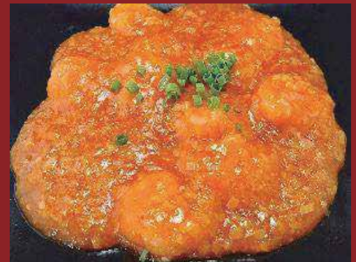
◎海老のチリソース煮