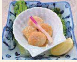
帆立貝バター焼き