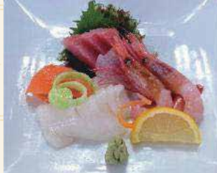
刺身4種盛り合わせ