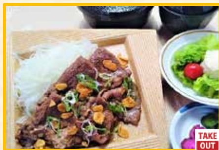
牛肉の生姜焼き定食