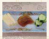
漬物3種 盛り合わせ