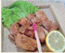
桜姫鶏モモ肉の照り焼き