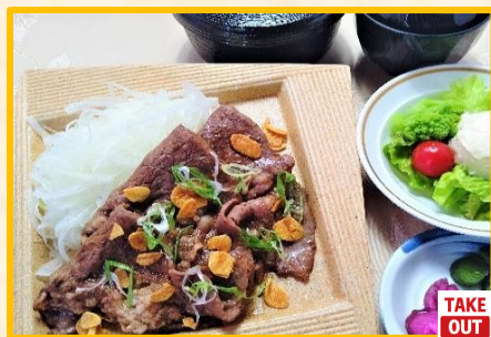
牛肉の生姜焼き定食