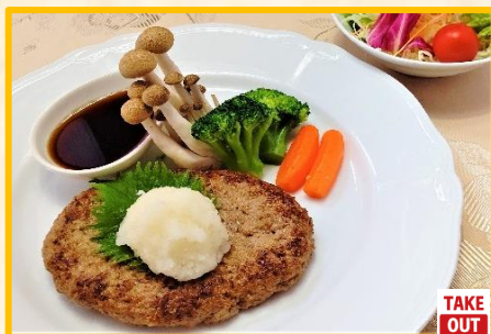
和風おろしハンバーグ