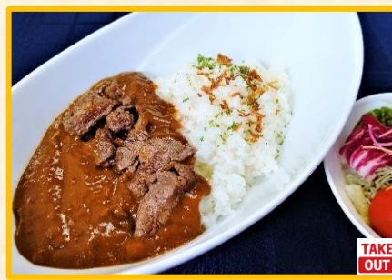
カットビーフのせカレー