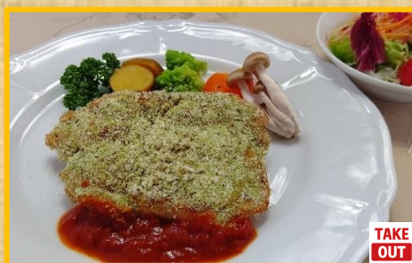
チキンの香草パン粉焼き