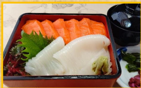
サーモンとイカの二色重