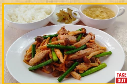
鶏肉と野菜の麻辣炒め