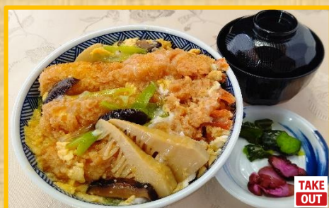
筍と海老の玉とじ丼