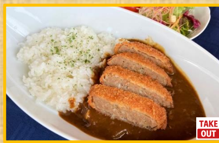
メンチカツカレー